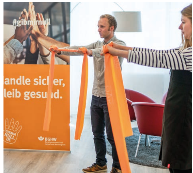
Bewegung in der Aktivierungspause: „Topfit-Macher“ motivieren ihre Kolleginnen und Kollegen

Beim Handels- und Touristikkonzern Rewe Group mit Sitz in Köln arbeiten rund 250.000 Beschäftigte. Das Unternehmen hat für sie mit seinem Onlineportal „Gemeinsam topfit“ eine flächendeckende und zeitgemäße Form der betrieblichen Gesundheitsförderung ins Leben gerufen.